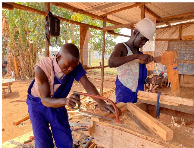
画像左：グローバル人財授業の様子 / 画像右：ウガンダで木工大工の職業訓練をする受益者

企業版ふるさと納税での寄附は佐賀県で行うグローバル人財の育成事業に充てられます。本事業はSDGsを推進し、佐賀と世界の未来を担う人財を育成することを目的として2021年からスタートしました。未来を担う若者（高校生）が、主体的に社会と関わって他者に貢献できる市民となるよう、Project Based Learning（以下、PBL：問題解決型学習）の手法を取り入れて学びます。