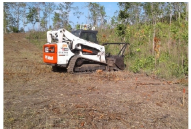
写真上: 第5機械チーム、ボブキャットがチャムノッチ・スラエ・トラーチ1-BS/CMAA/09495地雷原の土地整備を実施する様子

機械チームは、土地を整備する機械であるボブキャットを使用し、地雷原番号BS/CMAA/01285、BS/CMAA/06882、BS/CMAA/09494、BS/CMAA/09495の4月-6月の期間、バタンバン州サムロート郡オウ・ルモン村、チャムラン・ロミエン・クラオム村、タ・サニユ・カン・チュン村4ヶ所の地雷原の89,786 m 2 の土地の整備を実施しました。