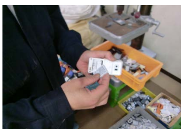
1.不純物(バッテリー)の除去

安田産業では、環境・品質に加えて、 ISO27001 という情報セキュリティに関する規格も認証を取得しています。また、情報機器のデータ破壊をする際は全て屋内の管理が行き届いたところで作業されるので、ご安心ください。