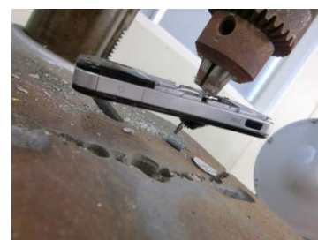
2.本体部分に穴を開ける